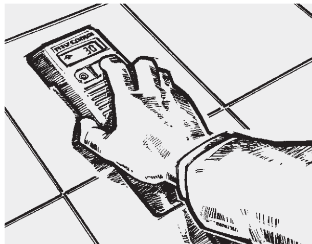
Jednoduchá nivelace díky jednotlačítkové obsluze (typické použití ručního přístroje)

Přístroj je tvořen kompaktním hadicovým bubnem se zápusťnými klikami, speciální hadicí a ručním přístrojem s displejem a jedním tlačítkem. Modul pro přesné měření, který je součástí ručního přístroje, měří rozdíl tlaku kapaliny mezi bubnem a ručním přístrojem.